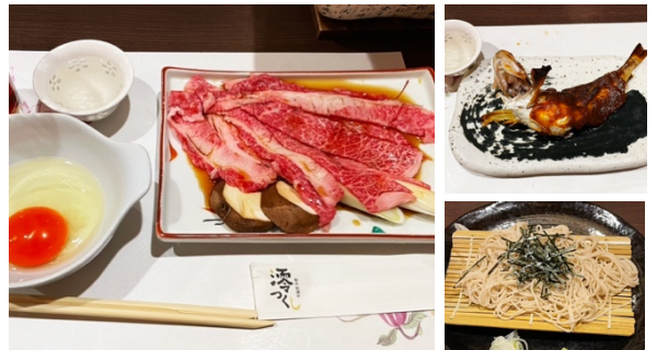
締めのお蕎麦が人気でした！

今年も、みなさまのご参加をいつでもお待ちしております！ 2025年もどうぞよろしくお願い致します。